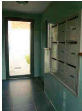
► Entrée principale