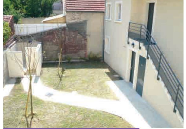
► Le bâtiment côté Carnot et la cour intérieure (vue du bâtiment côté Barbusse)

Les garages existants ont été démolis, donnant leur surface à une cour intérieure végétalisée, ainsi qu'à un local vide-ordures et à un local d'entretien.