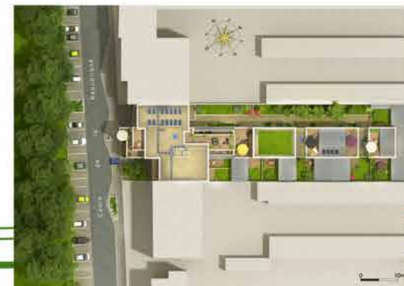
Implantation sur la parcelle