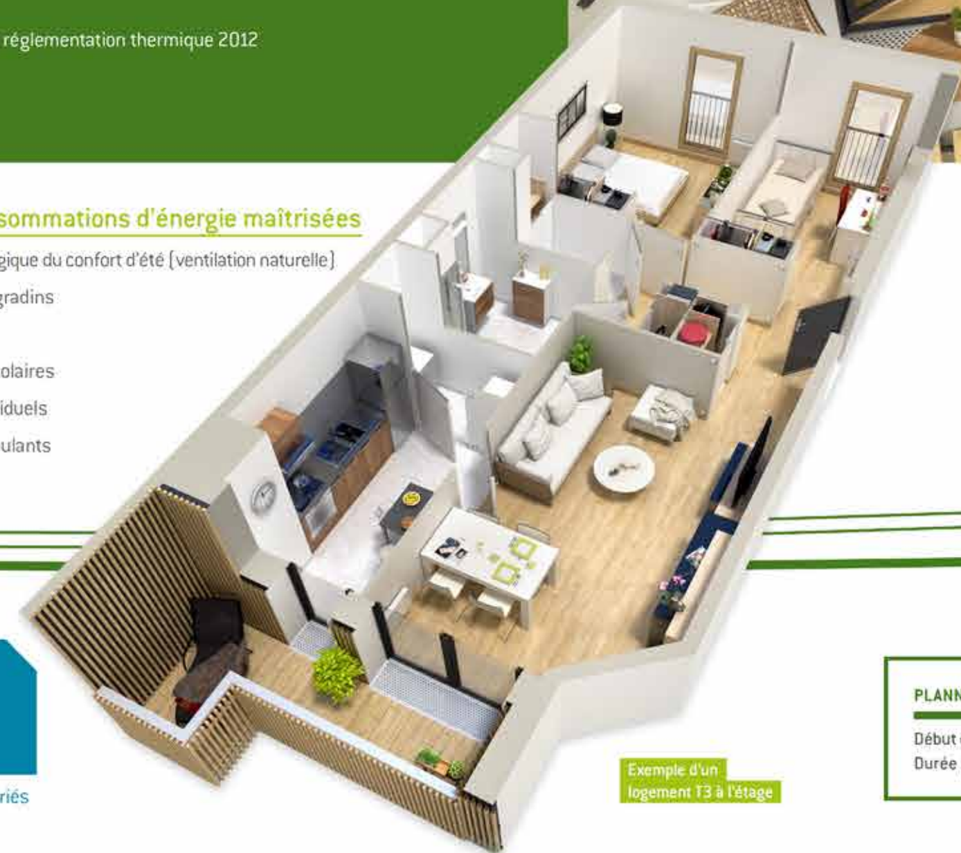
Exemple d'un logement T3 à l'étage

* TVA 5,5 % incluse, hors parking et hors frais notariés